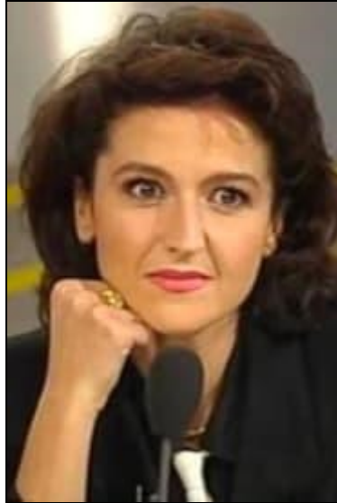
Chantal, Tefaha HALIMI dite GALLIA